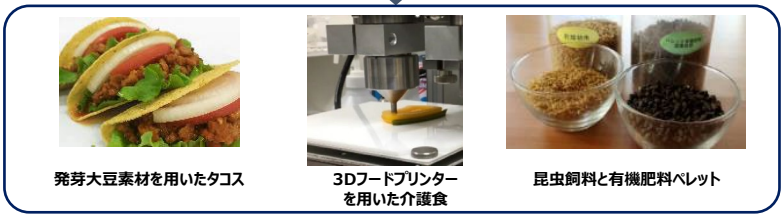
事業戦略検討、試作品製造、マーケティングリサーチ、商品デザイン、テストマーケティング、販路確保、原材料確保